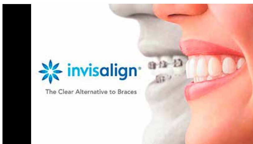
Figura 2 – Anúncio publicitário do aparelho invisalign® que ficou muito conhecido no Brasil no início dos anos 2000 e que foi muito criticado pela comparação inadequada com o aparelho fixo, o que é antiético pelo CEO.