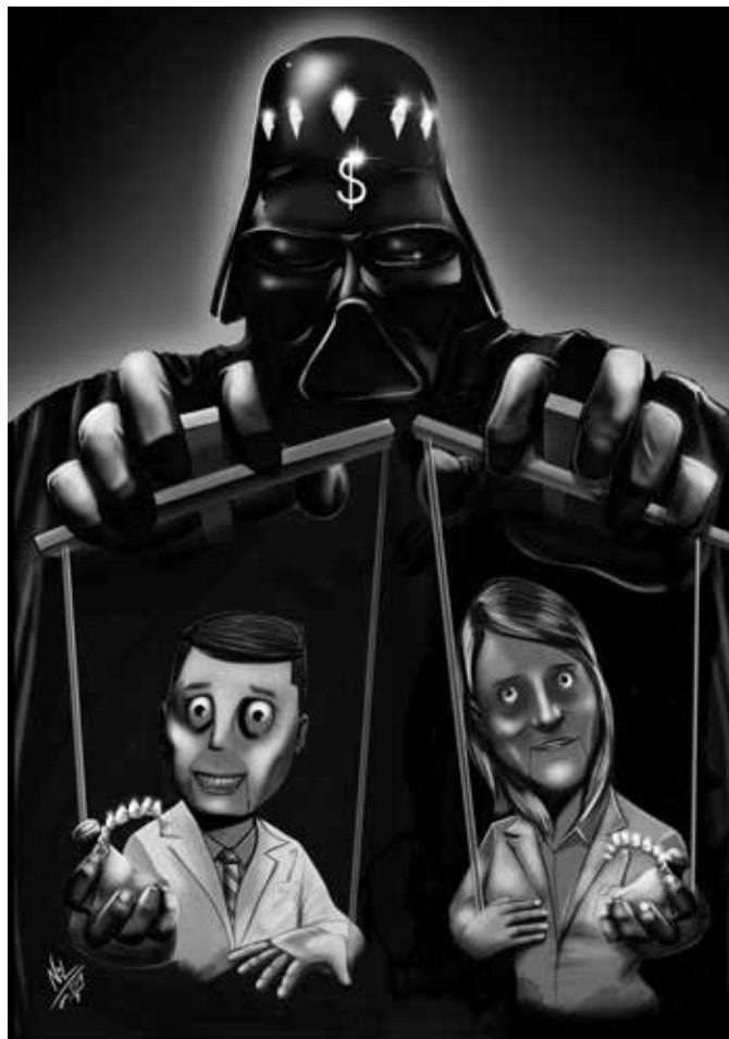
Figura 5 – Caricatura encomendada ao artista Nil Martins, que satiriza a manipulação de profissionais que estariam inadvertidamente servindo aos interesses comerciais de uma poderosa e multimilionária corporação, o que facilmente poderia servir de roteiro para um dos episódios da série Black Mirror .

Mas saiba quando indicar. Use alinhadores! — Mas conheça todos os sistemas disponíveis, inclusive, muito provavelmente você produzirá seus próprios alinhadores in-house em breve e isso irá resolver uma grande parte dos seus casos, onde de fato os alinhadores estão indicados. Use alinhadores! — Mas não passe para a sociedade, para os seus colegas e principalmente para os clientes em potencial que o “aparelho” que você usa é mais importante e valioso do que o seu trabalho, do que a sua capacidade de saber diagnosticar e planejar tratamentos, do que o seu senso ético e compro-