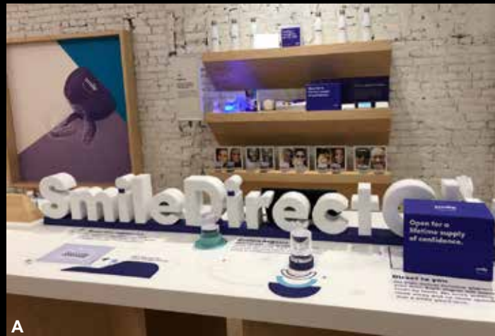
Figura 3 (A-B) – A-B Fachada de uma das lojas da Smile Direct Club, na Fifth Avenue em Nova Iorque, onde qualquer um pode agendar uma sessão de escaneamento intraoral, aprovar seu próprio planejamento virtual e receber seus alinhadores em casa, sem a “interferência” de um ortodontista, o mesmo de um cirurgião-dentista clínico geral.