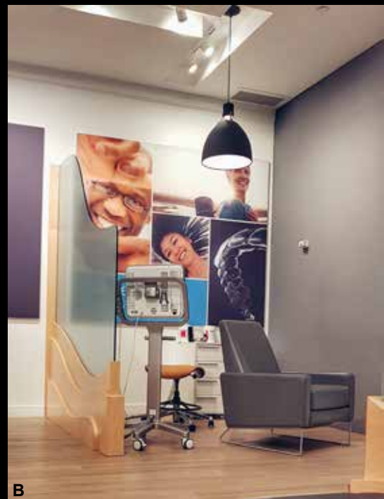
Figura 4 (A-B) – A Interior de uma “invisaling® store” com layout similar às lojas da Apple®, com uma atmosfera que pretende transmitir a sensação de perfeição, sucesso, eficiência, retratando o marketing metuculoso da companhia. Essa loja, fechada por decisão judicial, ficava abrigada no Westfield Valley Fair em San Jose, na Califórnia, onde, aliás está localizado o quartel general da Align Technology. B Booth onde o cliente já podia ser escaneado e em 15 minutos recebia o seu “plano de tratamento” virtual, apresentado por um técnico que oferecia três opção de pacotes de tratamento.