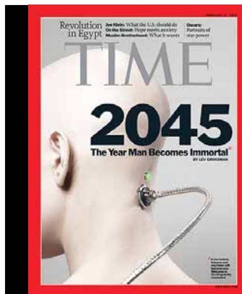
Figura 1 – Capa da Time Magazine de fevereiro de 2011.

“viagem”, mas é um dos assuntos em maior evidência no universo dos avanços tecnológicos e já foi capa da Time Magazine 1 (Figura 1).