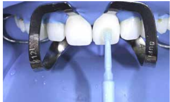
Figura 41 – Aplicação do sistema adesivo Excite F DSC.