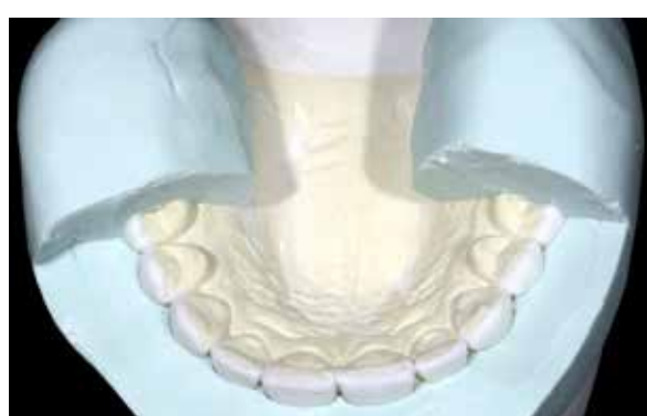
Figura 24 – Muralha silicone no modelo.