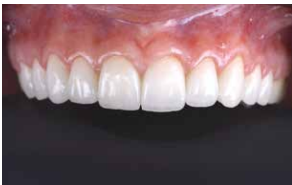
Figura 44 – Aspecto final.