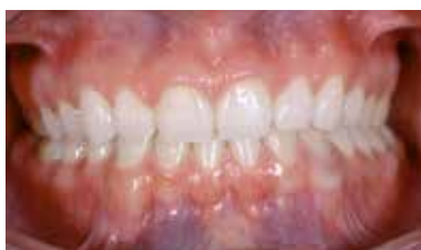
Figura 2 – Intrabucal frontal inicial