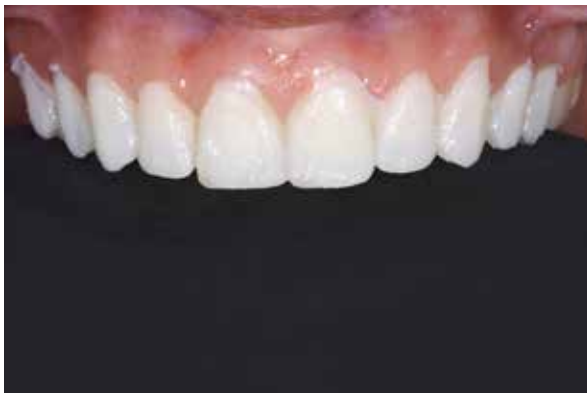
Figura 19 – Preparos sob o mock up .

22). Nesse momento, o mock up foi removido e as marcações de grafite conferidas no dente (Figura 23). Pequenos desgastes nessas áreas foram executados com o objetivo de obter espaço adequado para a restauração cerâmica. A conferência dos espaços foi feita com muralhas de silicone de condensação obtidas a partir do modelo de gesso encerado (Figura 24), tanto no sentido transversal (Figura 25), como no sentido longitudinal e espaço incisal (Figura 26). Os ângulos internos foram arredondados com ponta diamantada 2134F e FF (KG Sorensen, Brasil). Os preparos foram então devidamente polidos com broca multilaminada (Henry Shein) e discos sof lex 3M. Convém salientar que o término recebeu atenção especial, sendo executado de forma contínua e definido em chanfrado leve (Figura 27).