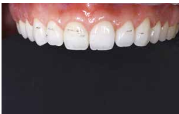
Figura 23 – Remoção Mock up.