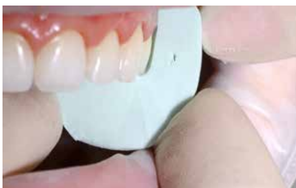
Figura 25 – Muralha de silicona sentido transversal.