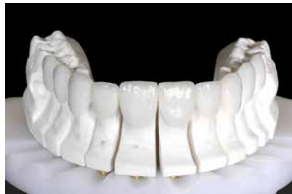
Figura 31 – Prova dos laminados no modelo.