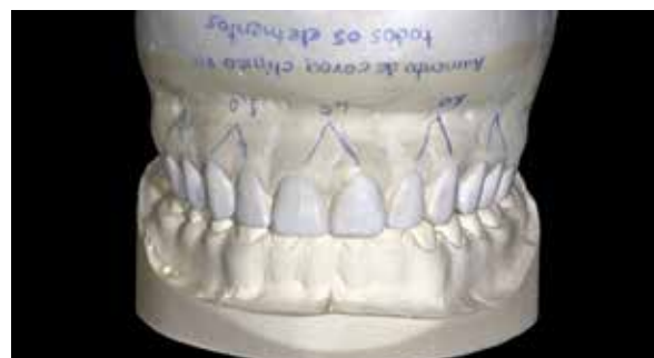
Figura 8 – Modelo de gesso com enceramento de diagnóstico.