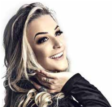
Figura 46 – Aspecto final facial.