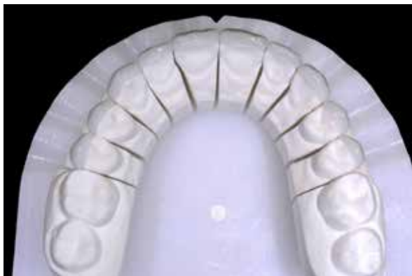
Figura 30 – Prova dos laminados no modelo.

a prova seca (Figura 32) e em seguida a úmida com try in do kit de cimento Variolink Esthetic LC (Figura 33). A cor selecionada foi a Neutral. Posteriormente, foi iniciada a etapa da cimentação.