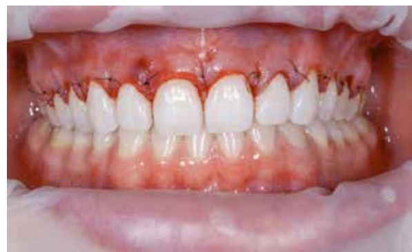
Figura 16 – Sutura.