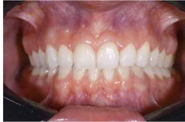
Figura 18 – Pós operatório 90 dias.

do foi a confecção de laminados cerâmicos ultrafinos nos dentes 15, 14, 13, 12, 11, 21, 22, 23, 24, 25, utilizando-se um sistema cerâmico à base de feldspato reforçado com leucita na técnica do modelo refratário, Creaction CC.