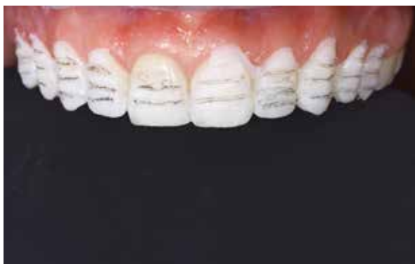
Figura 21 – Sulcos de orientação.