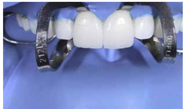
Figura 43 – Cimentação das laminas com Isolamento Absoluto.