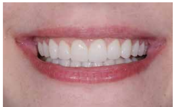
Figura 45 – Aspecto final.