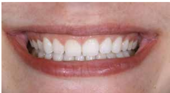
Figura 4 – Sorriso frontal inicial.