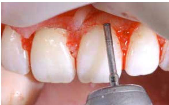
Figura 15 – Remoção do tecido ósseo.