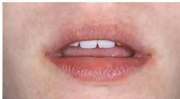
Figura 5 – Repouso Inicial.