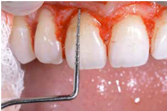
Figura 13 – Descolamento gengival para expor tecido ósseo.

Foi feita a remoção do tecido ósseo com auxílio de cinzel de Oschseiben #1, broca diamantada cilíndrica topo plano KG Sorensen nº 2173. e broca esférica 1014 (Figura 15). Após verificação do espaço biológico e das medidas corretas foi executada a sutura com fio de nylon 6.0, em pontos de colchoeiro em cada papila (Figura 16). A finalização do procedimento foi realizada por meio de uma irrigação com solução fisiológica e compressão com gaze umedecida.