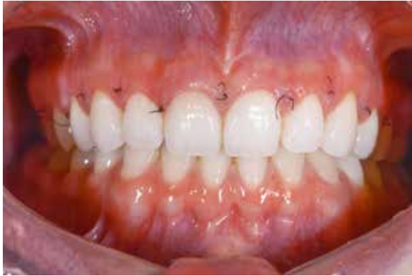
Figura 17 – Pós operatório 10 dias.

A remoção da sutura foi feita em 10 dias e o pós-operatório foi excelente, sem nenhuma complicação ou dor relatada pela paciente (Figura 17). Dessa forma, 90 dias após a cicatrização, iniciou-se o procedimento reabilitador estético (Figura 18). O tratamento escolhi-