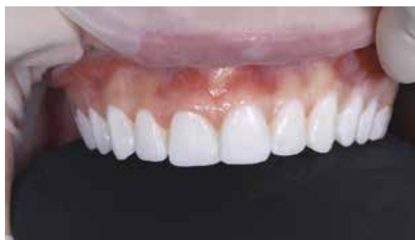
Figura 9 – Mock Up- Enceramento de diagnóstico em resina bisacrílica.