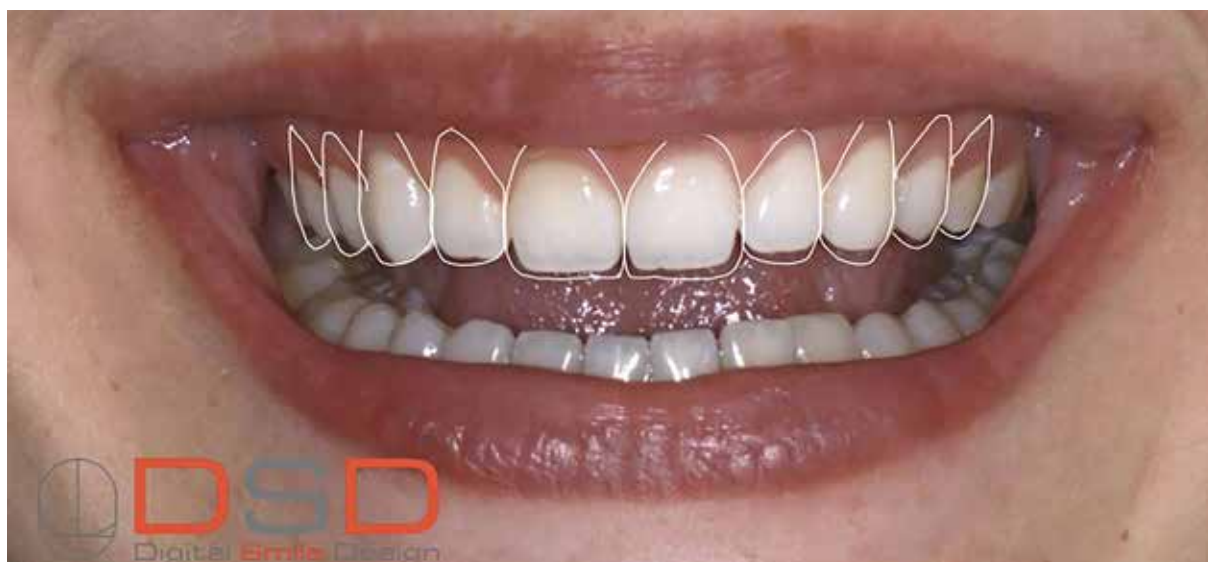
Figura 6 – Planejamento DSD.

vectomia/osteotomia, fez-se assepsia intra e extraoral, seguida de anestesia da região pela técnica infiltrativa com uso de anestésico articaina a 4%. As incisões foram executadas com bisturi lâmina 15c, tangenciando-se o mock up (Figura 10). Após, foi executada a remoção do mock up (Figura 11) e as incisões foram confirmadas (Figura 12). O tecido gengival foi removido com auxílio de uma cureta periodontal Gracey 5/6.