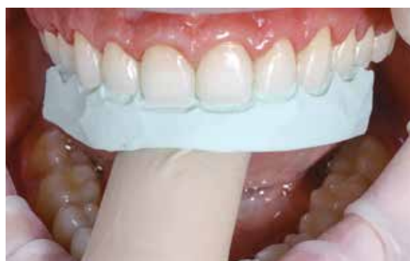
Figura 26 – Muralha de silicona sentido longitudinal.