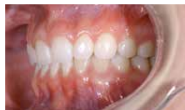
Figura 3 – Intrabucal lateral esquerda inicial