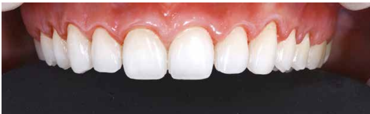
Figura 27 – Termino dos preparos definido.