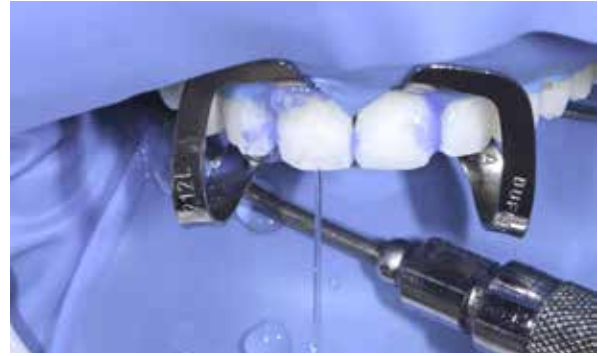
Figura 39 – Condicionamento com acido fosfórico.