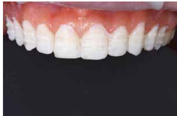
Figura 20 – Desgaste 3 planos de orientação.