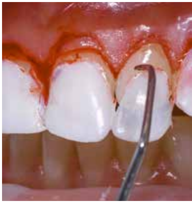
Figura 11 – Remoção do Mock Up.