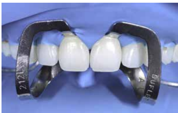
Figura 36 – Isolamento absoluto.

O ajuste da oclusão foi executado em Máxima Intercuspidação Habitual de forma criteriosa, sendo também verificados os movimentos de protusão e lateralidade. O aspecto final do caso demonstrou solução para as queixas da paciente, tanto na questão do volume (Figura 44), como para questão da exposição gengival (Figura 45). O resultado estético obtido harmonizou-se com a face da paciente (Figura 46).