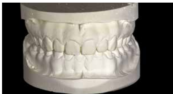
Figura 7 – Modelo de gesso inicial.