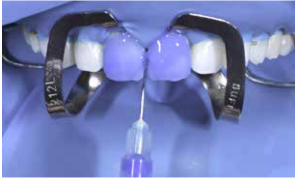
Figura 38 – Condicionamento com acido fosfórico.