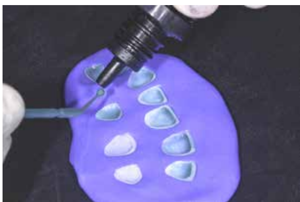
Figura 34 – Posicionamento das laminas na silicóna de adição.

lifluoreto de amônio, metacrilato de silano e corante) por 40 segundos (Figura 35) (Phark, Sartori, Sillas Duarte, 2016). Após o tempo de tratamento recomendado, o monobond etch & prime foi lavado por 60s e seco.