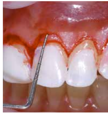
Figura 12 – Confirmação das Incisões.

Depois da correção do rebordo gengival, ao medir a profundidade clínica de sondagem e conferir as medidas no modelo encerado e no DSD, fez-se o descolamento gengival para expor o tecido ósseo subjacente (Figuras 13 e 14). Deve-se considerar que a distância entre a junção cimento-esmalte e o nível ósseo deve ser de no mínimo 3 mm para preservação do espaço biológico, em casos em que haverá futura reabilitação protética, o que se deve levar em conta é a distância entre a futura margem protética e o nível ósseo, que