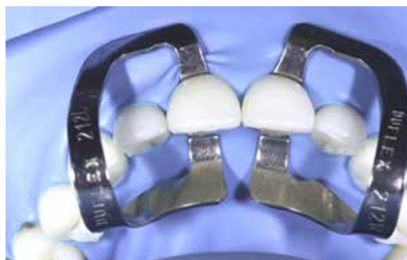
Figura 37 – Isolamento absoluto.