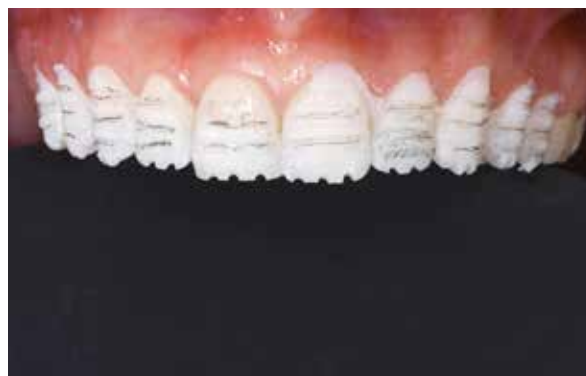
Figura 22 – Confeção dos preparos.