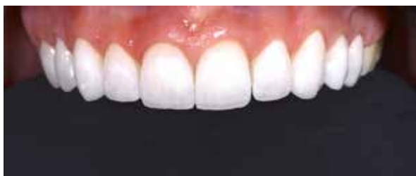
Figura 32 – Prova seca em boca.