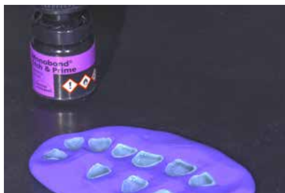
Figura 35 – Condicionamento das superfícies internas com monobond etch & prime .

Os dentes foram previamente isolados de forma absoluta (Figuras 36 e 37) e sofreram condicionamento ácido fosfórico (Figuras 38, 39 e 40) e aplicação do sistema adesivo Excite F DSC (Figuras 41 e 42), removidos os excessos e fotopolimerizado. O cimento resinoso fotopolimerizável Variolink Esthetic na cor Neutral, previamente selecionado, foi aplicado na superfície da cerâmica e levado ao dente no sentido inciso-cervical (Figura 43).