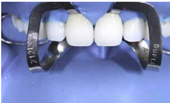
Figura 42 – Aplicação do sistema adesivo Excite F DSC.