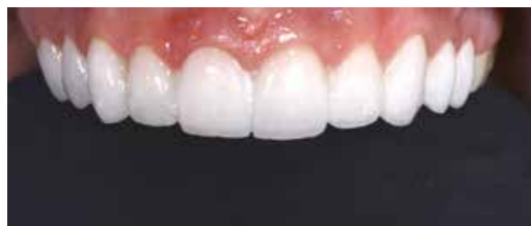
Figura 33 – Prova umida em boca com try in.

Para facilitar o tratamento interno das restaurações, elas foram posicionadas em uma base de silicóna de adição Virtual pasta densa (Figura 34). As superfícies internas dos laminados foram condicionadas com monobond etch & prime (solução aquosa alcoólica de po-