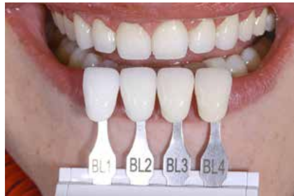
Figura 29 – Seleção de cor.

Na sessão clínica seguinte, foi realizada a prova dos laminados cerâmicos no modelo (Figuras 30 e 31) e em boca, para análise da cor, forma, adaptação marginal, além da aprovação do paciente. Inicialmente, foi feita