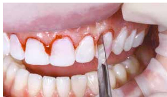
Figura 10 – Incisões tangenciando o Mock up.