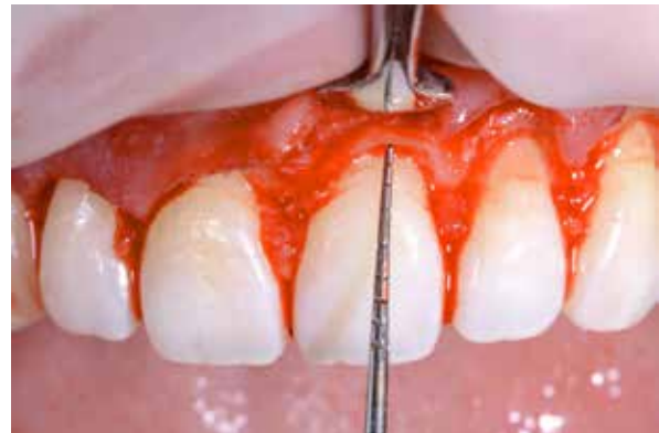
Figura 14 – Medição do Espaço biológico.