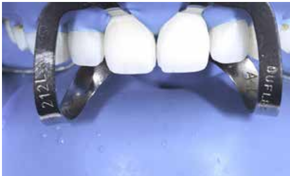
Figura 40 – Condicionamento com acido fosfórico.